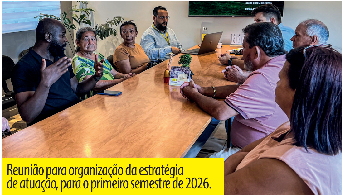
Reunião para organização da estratégia de atuação, para o primeiro semestre de 2026.