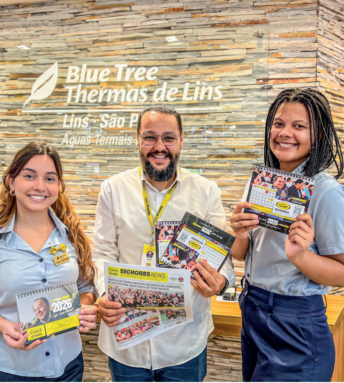
Blue Tree Thermas de Lins Lins - São Paulo Águas Termais